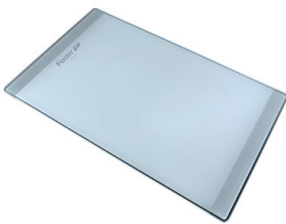
玻璃砧板 8631 300